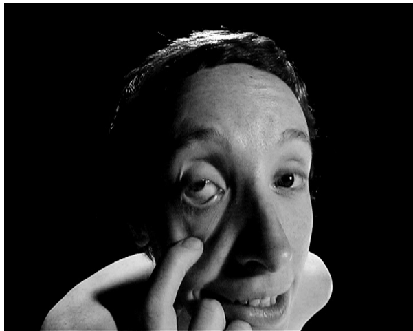
Abb.: Legal Errorist . Ein Film von Mara Mattuschka und Chris Haring (AT 2005, 15 Min.)

Die Bühnenshows dauern in der Regel etwa eine Stunde, Legal Errorist (die erste Kollaboration von Mara Mattuschka und Chris Haring 2005) nur 15 Minuten, Running Sushi (2008) und Burning Palace (2009) rund 30 Minuten. Eine Dokumentation der Tanz-