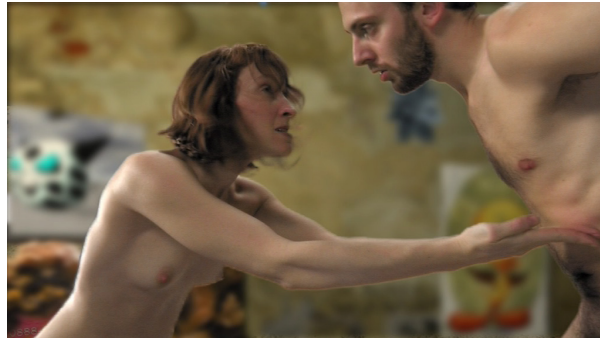
Abb.: Running Sushi . Ein Film von Mara Mattuschka und Chris Haring (AT 2008, 28 Min.)